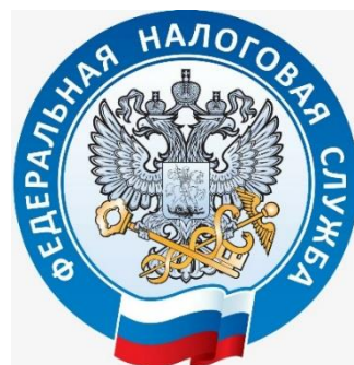
УФНС России по Пермскому краю